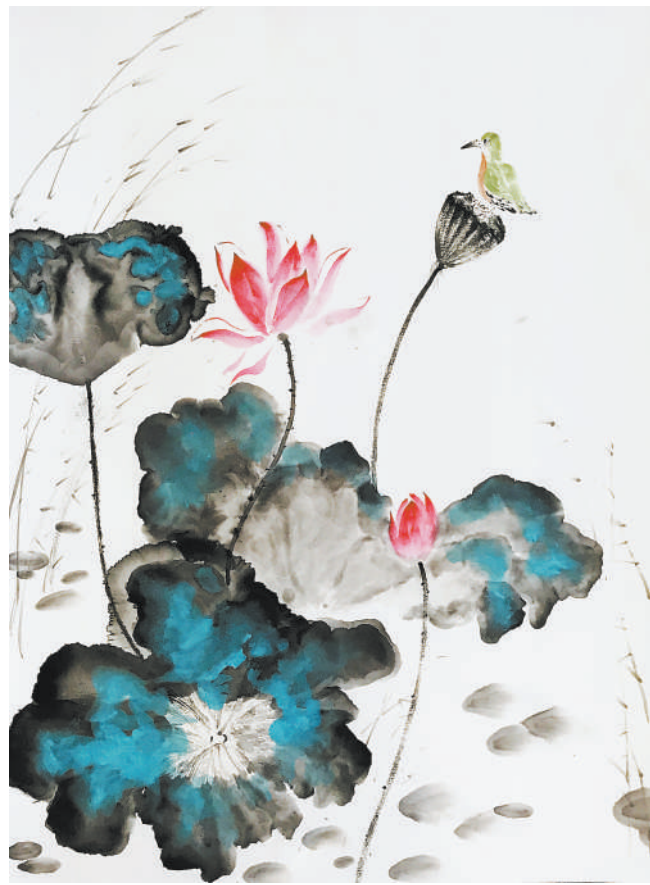
国画作品《荷》郭海燕(工会)