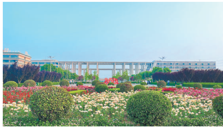
《花团锦簇》