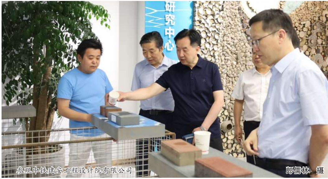
参观中铁建安工程设计院有限公司