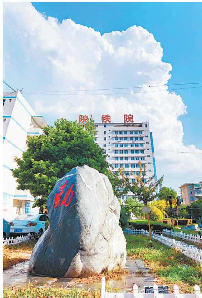
《晴空万里》